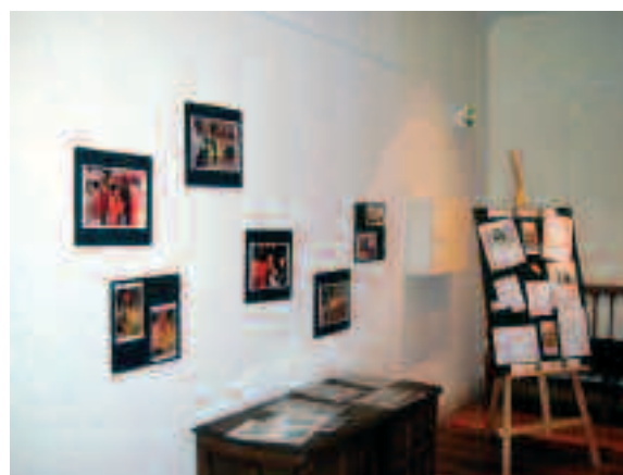
Exposición contra el canon por préstamos bibliotecarios en la Biblioteca de Baztán